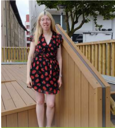
Elkarrizketa — 16. orr.

Lantegi Batuak Ehuneko ehun gai Cien por cien capaces