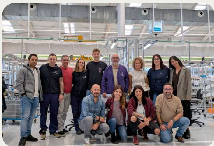
El equipo de Lantegi Batuak implicado este nuevo curso

www.lantegibatuak.eus/vuelve-la-academia-adaptada-de-lantegi-batuak