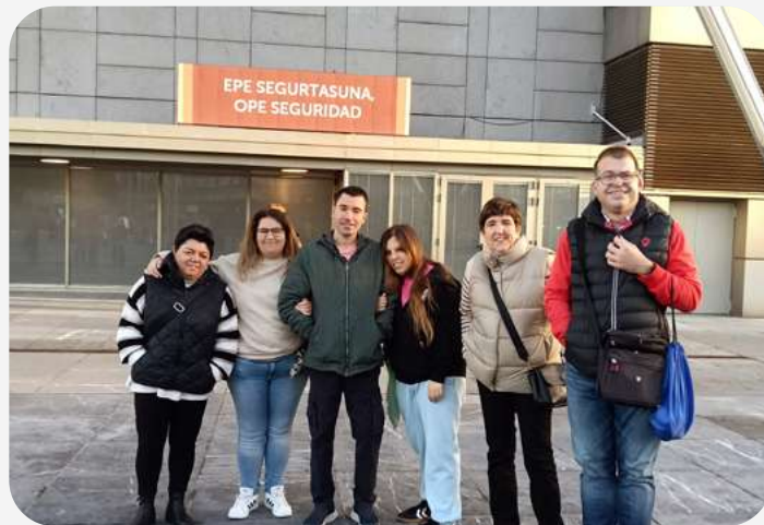
Asistentes a la primera prueba de la OPE del Gobierno Vasco