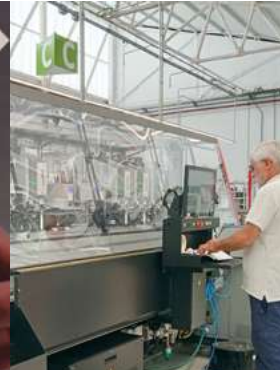
Apostando por las tecnologías — 8. orr.