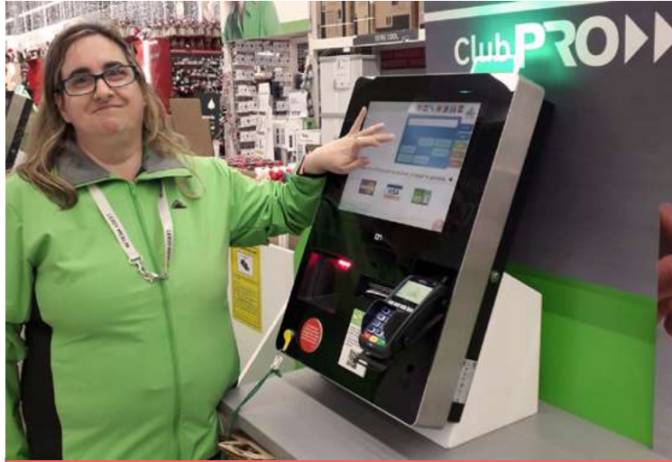
Empleo con Apoyo cumple 30 años — pág. 6