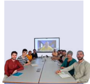
Ezagutu. Servicio de Sistemas — pág. 5